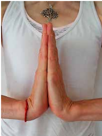
Namaskar (Anjali) Mudra